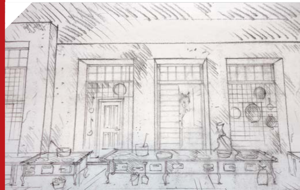
díszletterv: Menczel Róbert

kertben. A dolog arról szól, hogy hogyan képzelem el egy nem túl intelligens réteg azt, miképp néz ki ma egy arisztokrata, egy úr.